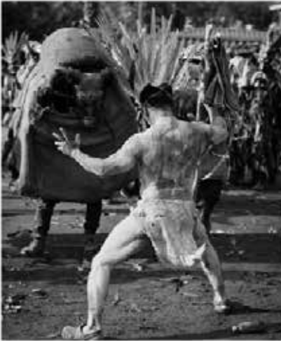
Fotografías de Alexander Ch Goul (detalle) Photography by Alexander Ch Goul (detail)

L´Hoxa InternationART Estado profundo del arte hoy N. 80 ENERO 2025 lhoxa.art